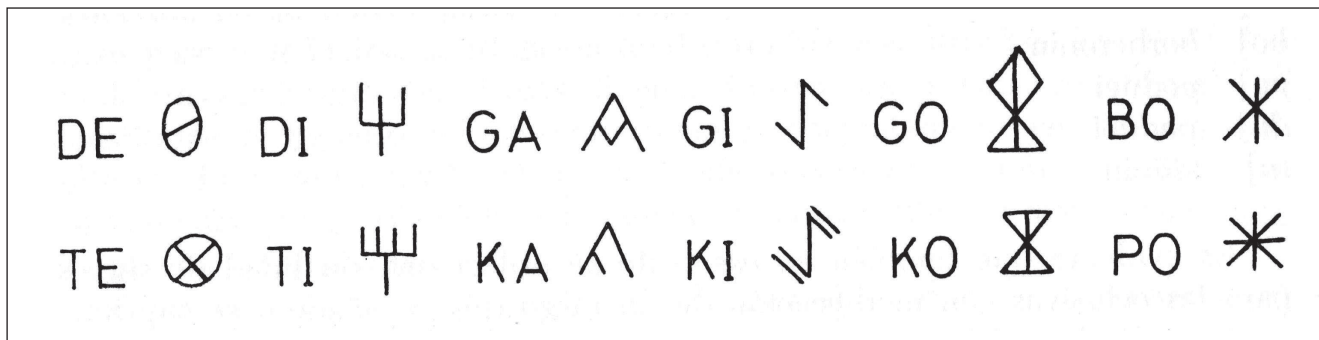
Figura 3. Les dualitats proposades per J. Maluquer (1968: 53).

del plomo, una misma palabra pueda ser notada indistintamente con uno u otro signo no altera la realidad de otros muchos casos. (Maluquer 1968: 53).