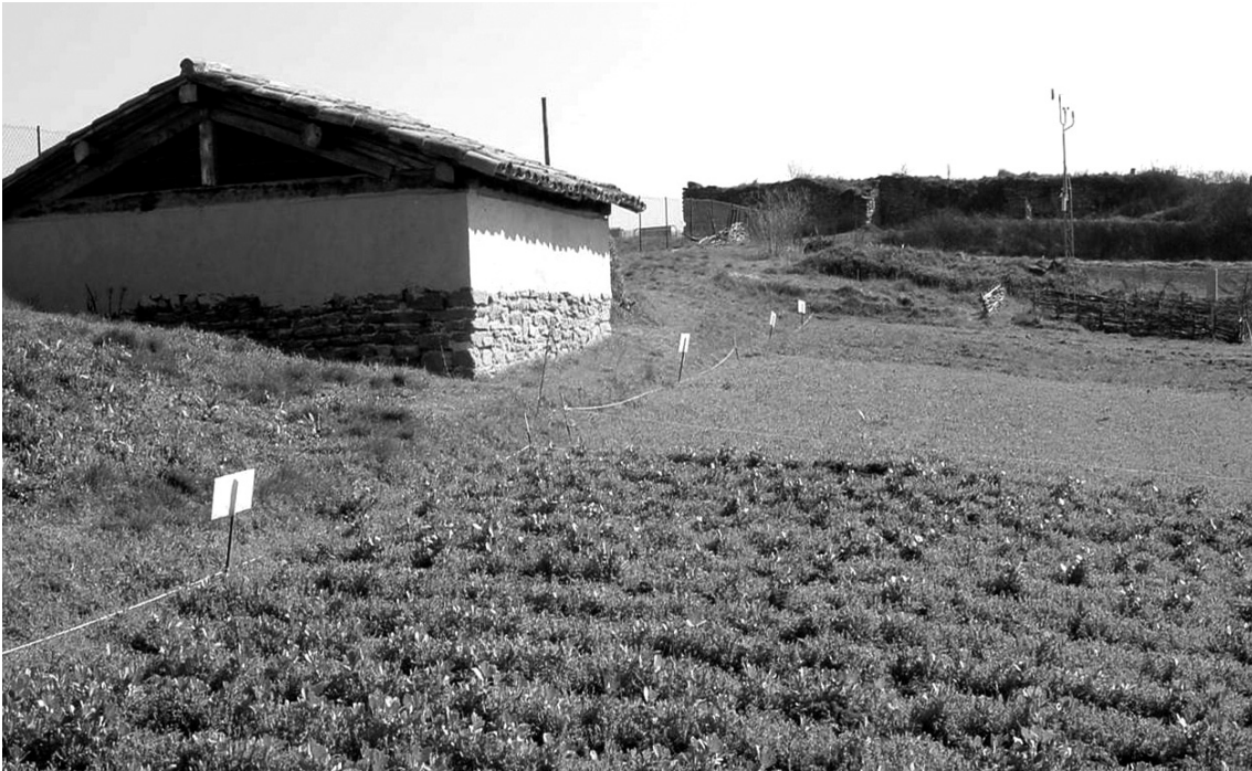
Arqueologia experimental: els camps i el graner medieval de l'Esquerda

Si apliquem el criteri econòmic de globalització a l'Arqueologia, ens plantejarem la intervenció a jaciments llunyans d'arreu del món —evidentment exòtics i rics— i amb mà d'obra local barata. El producte obtingut, la recerca, es recol·loca al món occidental i es revaloritza en forma de conferències, seminaris, exposicions, tesis doctorals i càtedres especialitzades. L'Administració està potenciant darrerament aquest tipus d'Arqueologia a l'estranger. 10 Potser caldria plantejar-nos si el nostre país s'ho pot permetre, i evitar que no es derivi cap a una forma nova del concepte decimonònic i colonialista de l'Arqueologia.