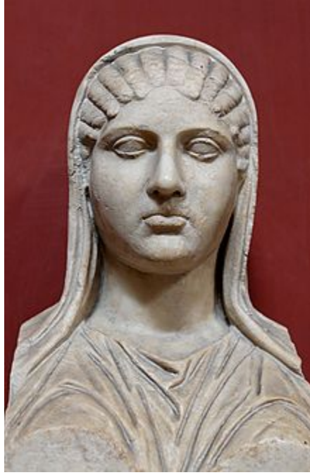
Aspasia de Mileto (470 a. C.– 400 a. C.), compañera de Pericles

http://es.wikipedia.org/wiki/Aspasia_de_Mileto