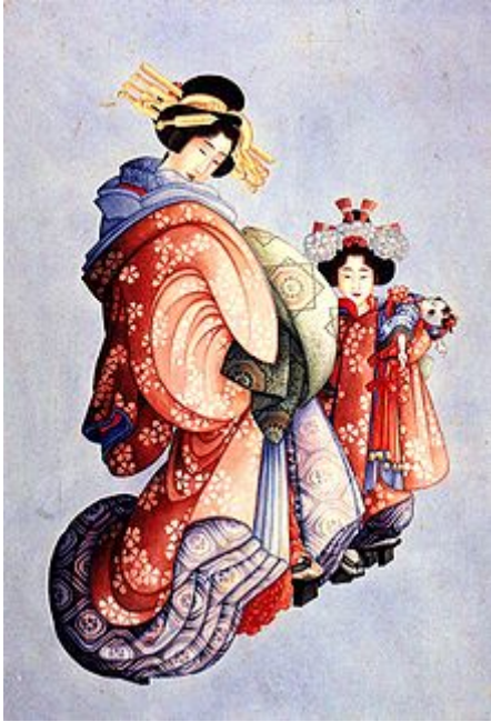
Una oiran y su kamuro, por Hokusai Katsushika.