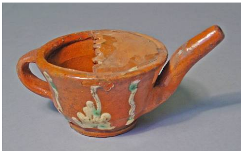
2. Terrissa vernissada. La Bisbal de l'Empordà. s. XIX

En algunes coves del període Neolític, s'hi ha documentat l'existència de banyes de bòvids – perforades en l'extrem més prim- molt probablement destinades a aquesta finalitat (2). Milers d'anys després, restes arqueològiques procedents de sepultures de l'època gal·lo romana, en forma de petits atuell de terrissa de mides i formes variades, proveïts de dos orificis, un de més