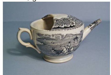
7. Porcellana decorada estil angl s. Probablement marca Pickman

Friedig-B ottger (1709), que s'obtingu  a Europa la porcellana (7), -fins aleshores arribava exclusivament de la Xina, on es guardava zelosament el secret de la seva fabricaci -. A partir d'aquell moment els industrials occidentals comen aren a emprar aquest material, tamb  conegut com "or blanc", en la producci  de grans i luxoses vaixelles, destinades a les cases reials i la noblesa, incorporant les tasses de broc com una pe a m s del conjunt tot allunyant-se, per , tant en la forma com en la decoraci , dels models artesanals.