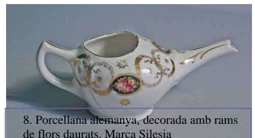
8. Porcellana alemanya, decorada amb rams de flors daurats. Marca Silesia

Les tasses amb broc poden ser llises o presentar