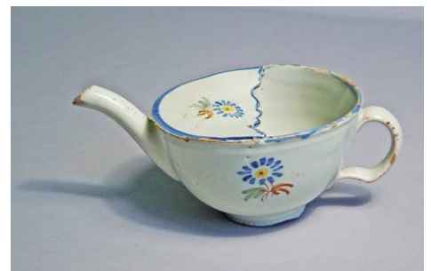
3. Terrissa d'Alcora. València. S.XIX. Marca A