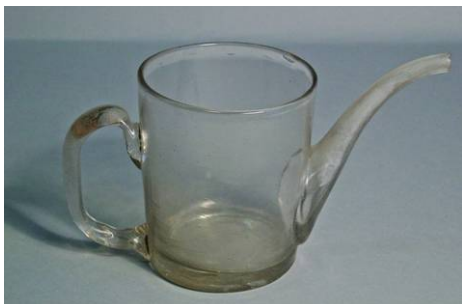
6. Vidre de manufactura artesana. Possiblement vidre catal . s. XIX

Els materials emprats en la fabricaci  de les tasses amb broc s n els mateixos que s'usaren, en cada  poca, en la confecci  del atuells dom stics m s comuns. Les m s antigues s n fetes de terrissa amb o sense vern s, tamb  se'n feren de fusta, plata, estany o vidre i, quan es varen obtenir altres tipus de cer mica de composici  m s noble, aquests materials tamb  s'incorporaren a la producci  de tasses amb broc, amb formes de gran bellesa.