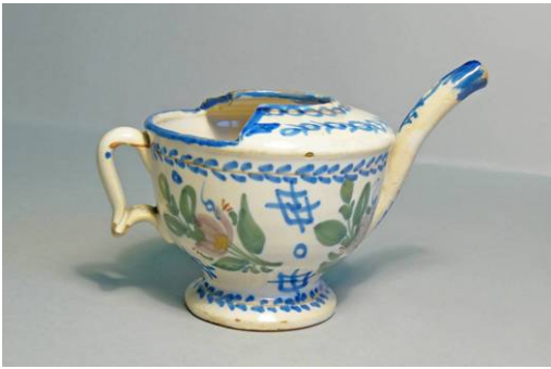
4. Terrissa decorada en blau, estil Manises. s. XIX