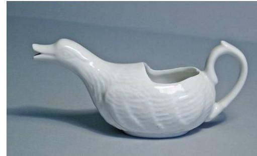
5. Porcellana blanca italiana, amb cos i cap d'ànec (canard). Marca: Porcellana Bianca. Fabriqu e par PILLIVUYT. France. Porcelaine

el broc de la tassa de malalt per a la seva neteja, l'han proscrit en tots els àmbits sanitaris en benefici dels estris d'un sol ús.