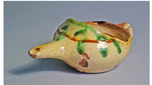
1. Terrissa decorada. La Bisbal de l'Empordà. s. XIX

Forma evolucionada de la tassa clàssica, la tassa de broc és un atuell emprat per administrar aliments líquids a nadons o a persones allitades, que té dues característiques ben definides: en primer lloc l'obertura superior està parcialment coberta per evitar el vessament en beure; la segona és la presència d'un broc, més o