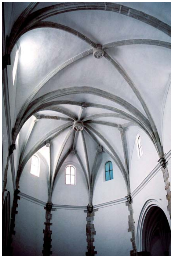
Figura 3. Martín García de Mendoza: interior de l'església de Sant Domènec de Tortosa (c. 1585).