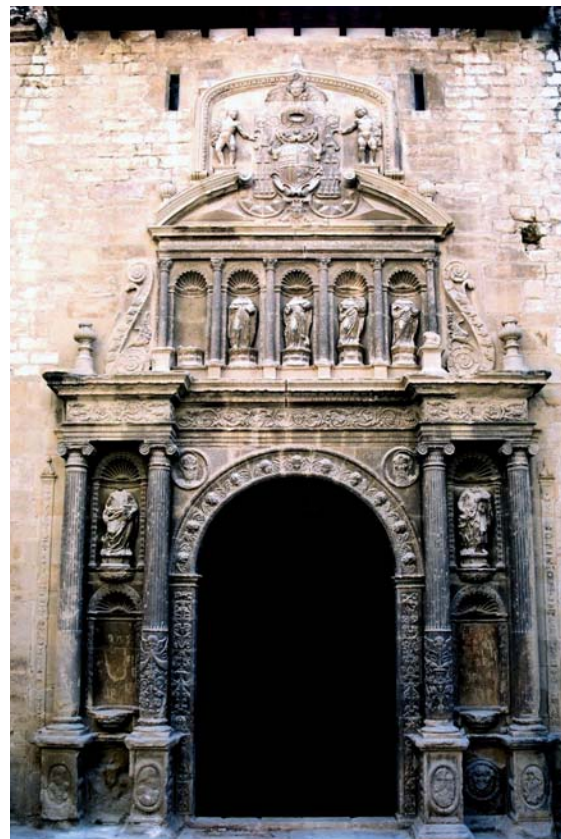
Figura 4. Martín García de Mendoza: portalada de l'església de Sant Domènec de Tortosa (c. 1585).

Però de la mateixa manera que va succeir amb Miquel Anglès, el qual —segons Gutiérrez-Cortines— va haver de canviar la seva tasca de tracista «por la direcció de las obras, donde actuó como empresario, al concertar la ejecución y colocar luego a otros canteros que trabajarán en su nombre» 29 , Mendoza es va veure obligat a treballar amb les «seves mans», ja fos dirigint obres i actuant com a empresari —aquest podria ser el cas,