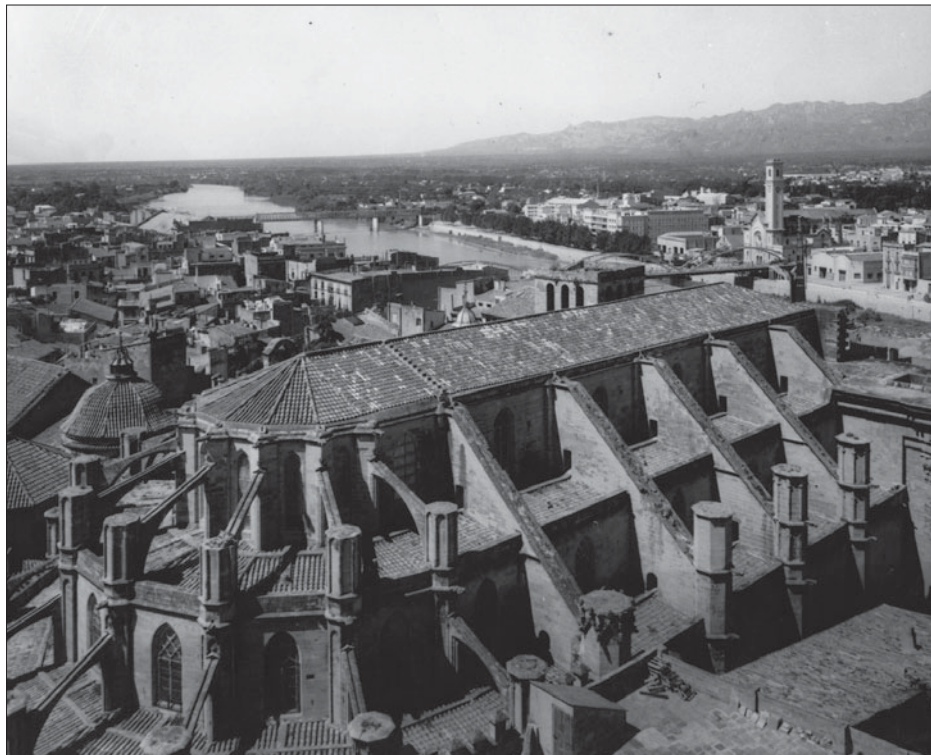
Figura 1. Catedral de Tortosa, construïda des del 1347. El segon, el tercer i l'inici del quart tram de la nau corresponen al segle XVI.