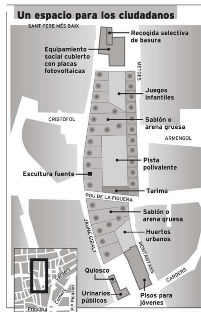
Proposta Ajuntament (2006-07) després del procés participatiu