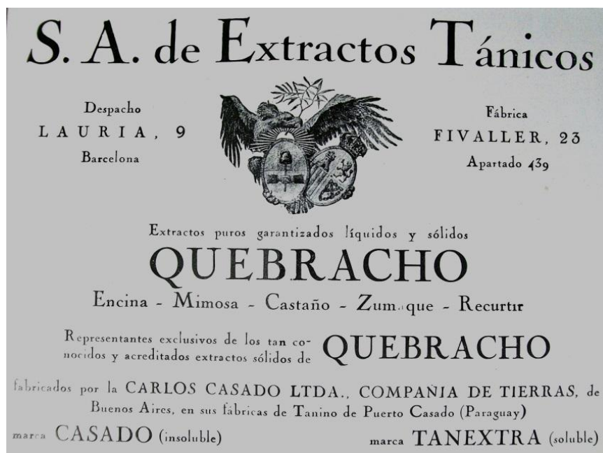
Imagen 1. Publicidad de la "S. A. de Extractos Tánicos". Revista mensual La Piel y sus Industrias, el arte de curtir , Barcelona.

La empresa que analizamos en este artículo conserva un folleto de la época referido a los "code condenser" internacionales, que sirvieron a la "S. A. Carlos Casado Limitada, Compañía de Tierras" para combinar un sistema de comunicación propio con la clave telegráfica particular de la "S. A. de Extractos Tánicos". En dicho folleto se incluyeron las instrucciones para cifrar los telegramas, así como las claves telegráficas. La palabra creada por el "código condensador" fue EDQOMBAGIR, que podía ser transformado en ED/QO/MB/AG/IR 18 . Es importante reproducir la publicidad de la "S. A. de Extractos Tánicos" que hizo la revista barcelonesa fundada por los de Corral y Tomé, primero llamada El Arte de Curtir , y posteriormente bautizada con el nombre de La Piel y sus Industrias, el arte de curtir (Imagen 1).