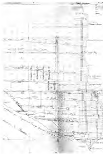
Imagen 1. Plano del Chaco considerado "paraguayo" en 1910. Elaborado por el agrimensor Ernesto Hlang en base a la lotificación de Antonio Codas. Fuente: La propiedad en el Chaco Paraguayo (1911). Asunción, Talleres Nacionales de H. Kraus.

otro enclave como era Puerto Pinasco: "Afin de bien comprendre les conditions de la lutte dans le Chaco, il est nécessaire de rappeler que le Paraguay avait construit, de longue date, diverses lignes de pénétration sur notre territoire, qui lui donnent aujourd'hui une immense supériorité de moyens de transports. Afin d'épargner de plus grands maux aux troupes boliviennes, qui sont suffisamment affectées par les énormes distances qu'elles ont à franchir pour défendre notre patrimoine national, il est absolument nécessaire de détruire ces lignes, ainsi que les gares et les dépôts où, depuis le début des hostilités, sont exclusivement employés à des fins militaires. D'autre part, le rio Paraguay étant la voie naturelle que l'adversaire emploie pour se ravitailler en armes et munitions, il n'est pas étonnant que nos aviateurs en fassent l'objet de leurs soins vigilants, en réservant leurs moyens de destruction à toutes ces parties vives qui servent à l'adversaire pour nous combattre. C'est ce qui est arrivé, aussi bien à Puerto Casado, qu'à Puerto Pinasco, têtes de lignes des chemins de fer qui desservent le front". 9