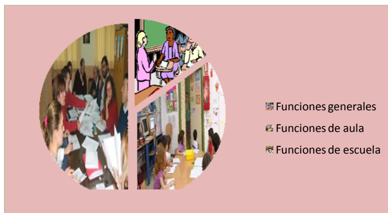
Gráfico 1. Comparación del tipo de funciones que se asignan al maestro/a.

a las del rol tradicional del maestro, que dibujan un perfil del maestro más profesional y conciben al maestro no solo en su labor estrictamente docente, sino con importantes desempeños de gestión educativa, de dinamizador cultural, y sobre todo de trabajo colaborativo. En el gráfico 1 se muestra la relación de esta distribución de funciones y el peso que la ley da a cada una de estas categorías: