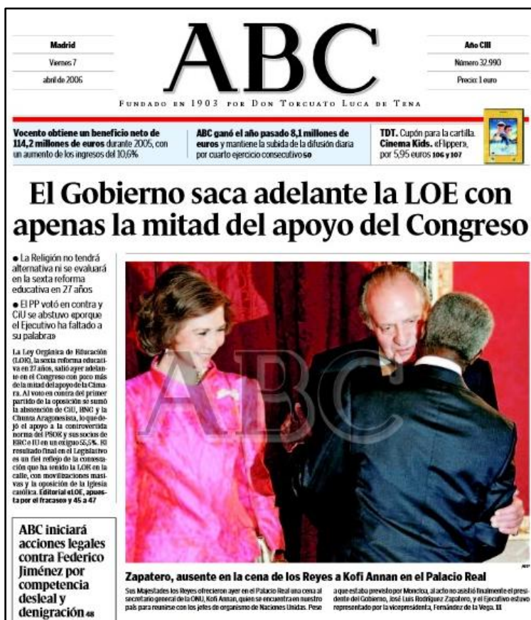
Portada del diari ABC del 7 d'abril del 2006

lleï, veïem com el diari va dedicar una portada a l'aprovació de la lleï. En aquesta, publicada el 7 d'abril del 2006, podia llegir-se al titular "El Govern tira endavant la LOE amb poc més de la meitat del suport del Congrés". En aquest mateix número, a més, podia llegir-se a la portada "la religió no tindrà alternativa ni s'avaluarà" i "el PP va votar en contra i CIU va abstenir-se perquè l'Executiu ha faltat a la seva paraula".