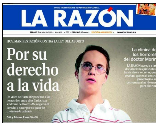
Portada del diari La Razón del 3 de juliol del 2010