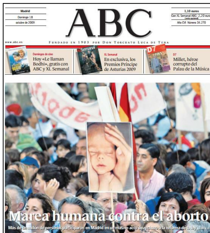
Portada del diari ABC del 19 d’octubre del 2009

El diari ABC igual que va fer La Razón, va donar amplitud al missatge dels col·lectius que s’oposaven a l’aprovació de la llei. En aquest cas, el diari ABC va publicar el 18 d’octubre del 2009 una portada en què es podia llegir com a titular “Marea humana contra l’avortament”, i s’anunciava que “Més d’un milió de persones van participar a Madrid en un massiu acte de rebuig a la reforma de la Llei.”.