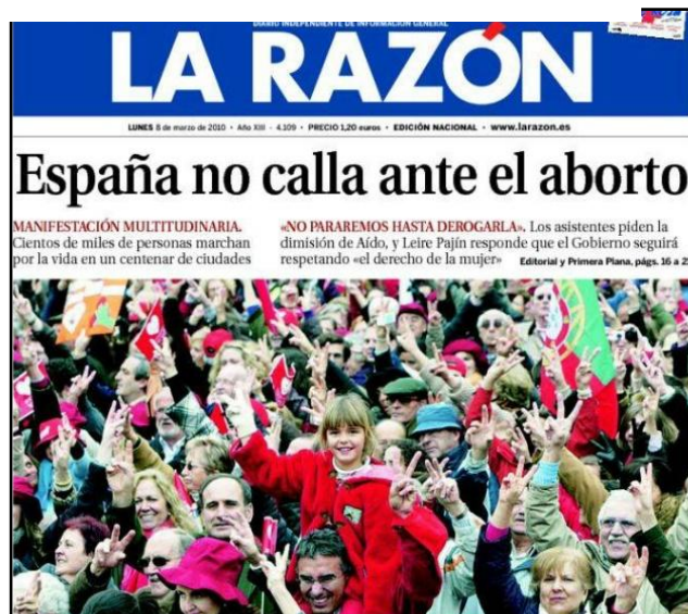
Portada del diari La Razón del 8 de març del 2010