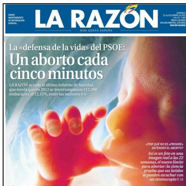
Portada del diari La Razón del 22 de desembre del 2013