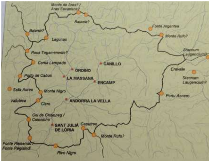
1. Topònims documentats dels límits de la vall d'Andorra (S.IX- XIII) J. BONALES, 2013.