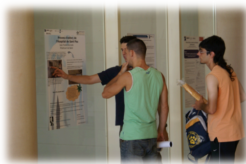
Imatge 1. Jornada Infopràcticum 2013.

Aquesta mateixa jornada és també el moment en que l'alumnat de 4t de Grau explica oralment a través dels pòsters respectius, a les persones que s'interessin pel mateix- especialment alumnat de tercer curs-, les tasques i activitats que ha dut a terme durant el seu pràcticum, com a síntesi del seu treball.