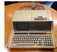
Figura 2. Us del Campus Virtual de la UB: un exemple a la Unitat de Bioestadística de la FM de UB (campus clínic).

Ordinador inicial de la UB de la FM de la UB el 1981