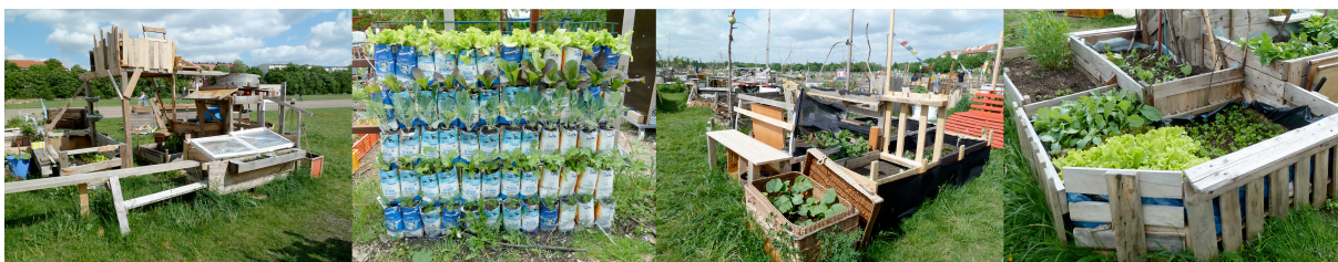
Figura 1. Horts a l'aeroport Tempelhof, Berlin (Associació Allmende-Kontor). Detall Prinzessinnengarten, Berlin.

Existeixen diferents tipologies d'hortos urbans i periurbans depenent de la situació socio-ambiental de cada ciutat o país. A centre Europa reben el nom de Kleingärten (petits jardins), Schrebergarten o Gartenkolonien , que consisteixen en terrenys de gran extensió parcel·lats i dedicats en el seu inici a l'horticultura i avui en dia també al cultiu de flors per l'autoconsum. Cada colònia d'hortos és d'una associació independent que s'autogestiona i sovint està regulat a nivell administratiu, amb una normativa mes o menys estricta que regula l'ús i finalitat. Avui dia són horts destinats a l'oci i l'autoconsum, tot i que els anomenats Community Gardens són horts comunitaris autogestionats que es caracteritzen per centrar-se en la creació de llaços comunitaris i en el desenvolupament local mitjançant activitats de formació i autoocupació.