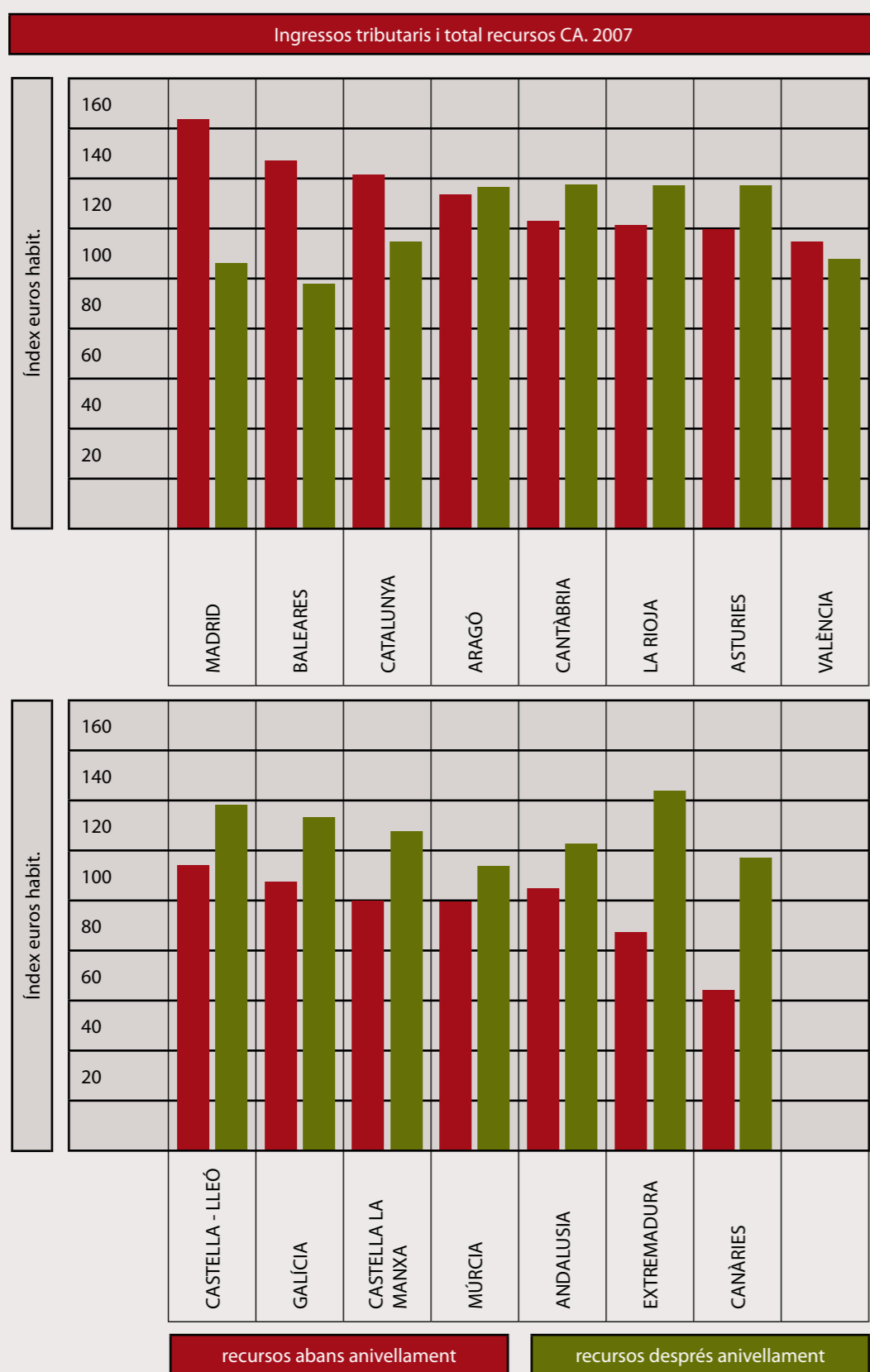
Gràfic 3. Efectes del mecanisme d'anivellament de les comunitats autònomes de règim comú