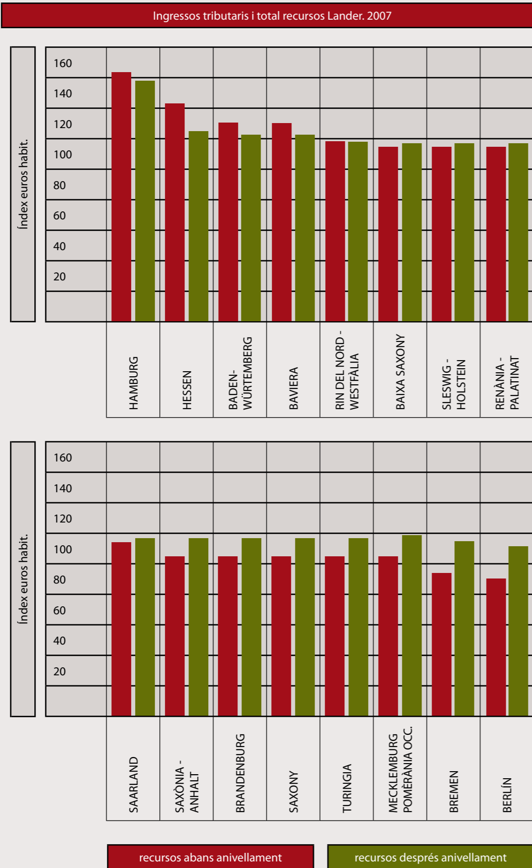
Gràfic 2. Efectes del mecanisme d'anivellament dels recursos dels länder (2007)