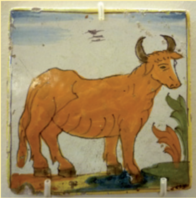
Figura 5. Rajola d'ofici del tipus palmeta amb dibuix d'un bou. Segle XVIII (MHS).