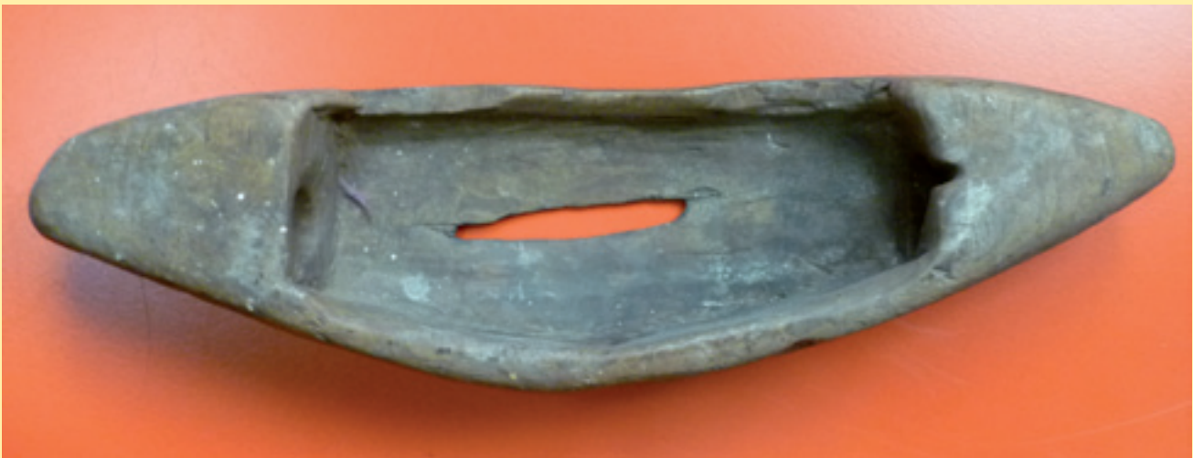
Figura 4. Llançadora de fusta d'un teler manual. Segle XVIII (MHS).