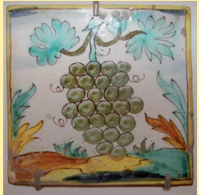
Figura 6. Rajola d'ofici del tipus palmeta amb dibuix d'un gotim de raïm. Segle XVIII (MHS).

La preponderància del sector secundari a Sabadell és encara més evident en observar les dades del sector primari. En efecte, la pagesia constituïa el 8,1% del cens, més el segment de jornalers 16,4%, que podrien relacionar-se molts d'ells d'una manera directa amb les feines agràries. Tanmateix, no hem de prendre de vista el fet que el padró indica la població resident dins el terme municipal de Sabadell i estava delimitat pràcticament en el perímetre urbà, amb la qual cosa en quedaven exclosos els habitants del rodal, és a dir, de masies disseminades en el territori proper, però pertanyents al terme municipal de Terrassa, molt més extens. D'altra banda, no hem d'oblidar la complementarietat que sempre hi ha hagut entre les feines al camp i a l'hort, juntament amb les pròpies del taller artesanal que desenvolupaven moltes famílies menestrals. Per dessota se situen els membres que integraven les anomenades professions liberals, amb el 2,2% del cens, i els hisendats, més un grup heterogeni que hem englobat com "altres activitats", en el qual s'hi ha sumat un compendi vari d'individus dedicats al servei domèstic (1,2%). Per últim, el Quadre 6 mostra el nombre de gitanos i pobres censats al