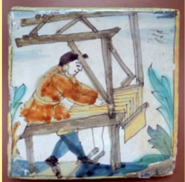
Figura 3. Rajola d'ofici del tipus palmeta amb dibuix d'un teixidor fent funcionar un teler manual. Segle XVIII (MHS).