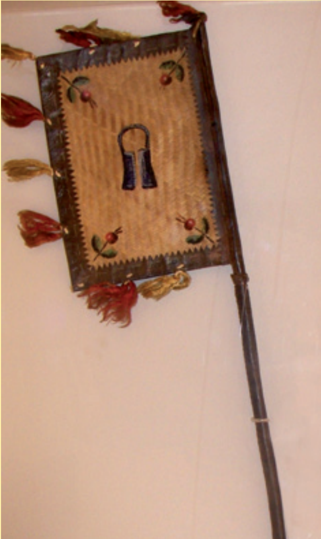
Figura 2. Ventall de processó del Gremi de Paraires, decorat amb unes tondoses. Segle XVIII (MHS).