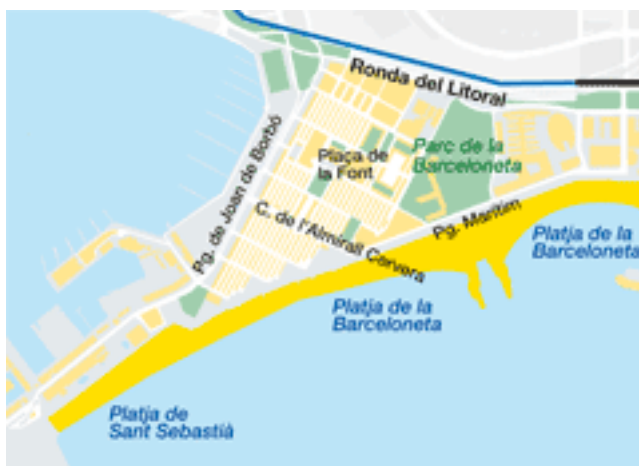
Figura 1: Plano del barrio de la Barceloneta