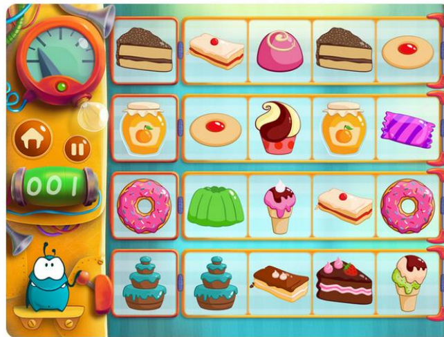
Figura 4. Crazy Fun Lab de Playtoddlers.

mentos activos, condición aceptable para usuarios de entre tres y ocho años. Sin embargo más de la mitad de la muestra presenta más de cuatro y hasta 39 elementos activos en la pantalla inicial. Un entorno aún más complejo se suele presentar en la pantalla del juego. Como se muestra en el ejemplo de la figura 4 de una aplicación orientada a la percepción visual, observación y memoria para niños de entre tres y cinco años (según el mismo desarrollador), que mantiene en cada una de sus pantallas más de 18 elementos activos.