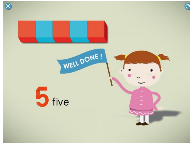
Figura 2. Feed-back textual sin refuerzo verbal de «Numberland» (Les Trois Elles-Edoki).

Los feed-back también presentan otros formatos: el 13% de la muestra incluye respuestas musicales, el 50% sonoras y el 50% visuales. Y la mayoría de retornos tienen una connotación emocional, que en el 35% es positiva y en el 11% tanto positiva como negativa.