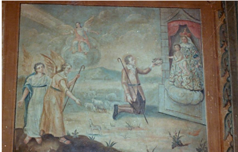
163. Pràctiques de devoció del jove Ramon

també hi participen dos àngels, i un nivell celestial superior amb el tercer àngel, al fons, que contempla el conjunt. Tot ell manté una certa profunditat i perspectiva.