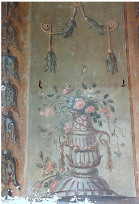
167. Elements vegetals i decoratius

Aquestes cinc escenes principals vénen delimitades per un marc quadrangular i sanefes geomètriques situades horitzontalment, amb motius ornamentals variats. Diverses bandes verticals amb decoració floral completen i enriqueixen el conjunt.