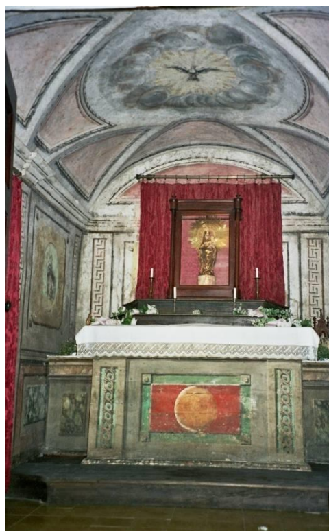
154. Conjunt: altar i imatge

La part central de l'altar ocupa un espai de 1,52 m. d'amplada, per 1,65 m. de fondària, amb la graonada descrita.