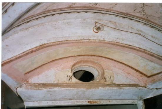
152. Oval superior i data