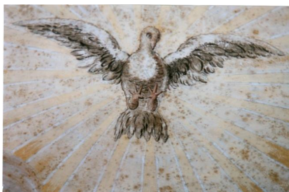
155 i 156. Conjunt i detall central de la decoració superior

A les parets laterals es representen les tres virtuts teològals, per mitjà de figures femenines amb els corresponents detalls al·legòrics. A la dreta vénen representades la Fe i l'Esperança i a l'esquerra la Caritat. La mateixa