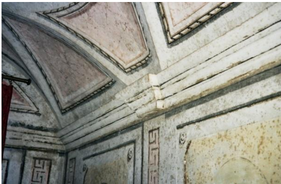
160. Motllura i motius geomètrics superiors

Una triple motllura al llarg de les parets laterals marca la separació entre aquestes i la volta superior.