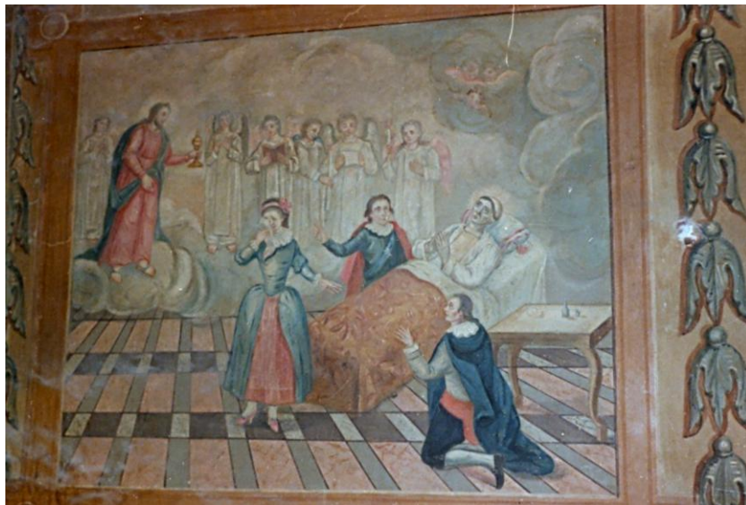
165. Mort de Sant Ramon

d). De retorn d'un dels seus viatges, i quan havia d'anar a Roma per a ser investit cardenal, Sant Ramon va morir al castell de Cardona. Segons la llegenda, el mateix Jesucrist li va administrar el viàtic, com apareix a l'angle superior esquerra de l'escena. En la part central es posa de manifest el desconsol terrenal dels personatges que acompanyen el Sant i l'actitud serena i pietosa d'aquest. Al fons, es representa el goig celestial, amb la companyia d'un cor d'àngels.