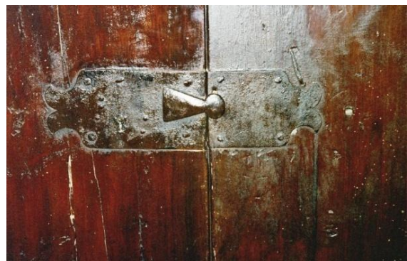
161. Detall interior del pany de la porta

La porta mostra, des de l'interior, la tanca amb el guardapany de ferro original, de mida considerable. A la sagristia, coberta amb volta d'aresta, destaca al fons una petita arcada cega de mig punt.