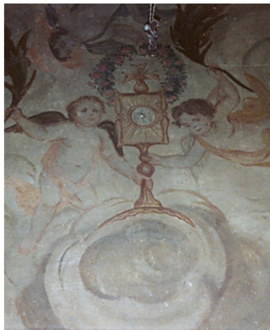
168. Motius eucarístics

Altres motius ocupen la resta d'espai, amb algunes escenes narratives complementàries i elements de caire ornamental. A la part central de la volta es