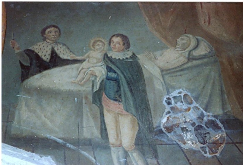
162. Naixement de Sant Ramon

a). Segons la tradició, Sant Ramon va ser extret del si de la seva mare ja difunta ( no nat ). L'escena mostra l'interior de la seva cambra. Un dels personatges masculins sosté el nen en braços i l'altre –es deia que era el senyor de Cardona, familiar seu- mostra la daga que ha fet possible el seu natalici. Aquest fet s'esdevé a la població de Portell. (Actualment dins el municipi de Sant Ramon, comarca de la Segarra).