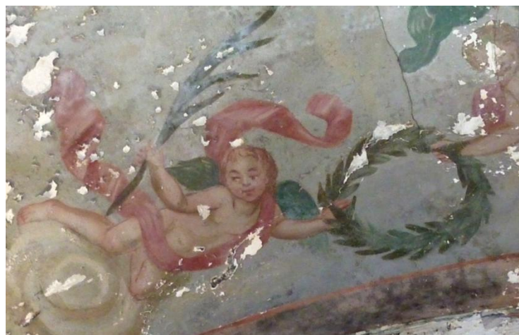
151. Fragment de pintura mural de l'oratori de Cal Guarro

11. Finalment, tot i tenir un origen molt més tardà, cal considerar l'oratori semipúblic o capella de Cal Batlle, per situar-se a l'interior d'un establiment paperer, ja que ocupava un local al costat de l'entrada superior del molí conegut anteriorment com a Ca l'Almirall. Establert o renovat el 1939, durant molts anys va funcionar com a delegació de la parròquia de la Torre de Claramunt, amb la celebració de la missa dominical i altres serveis religiosos per al veïnat de la Torre Baixa, allunyat d'aquella. Posteriors canvis generals i reformes de la fàbrica van ocasionar primer la supressió de les seves funcions i, finalment, la pèrdua de la pròpia capella, cap a l'últim terç del segle XX.