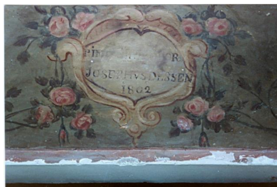
170. Autor i data

Com a resum, es pot manifestar que en el conjunt decoratiu d'aquest oratori es mostren escenes completes, amb colors variats i detalls precisos que fan més entenedor el relat. La seqüència narrativa té una plàstica expressiva i realista, amb tocs senzills i populars. En les figures es ressalta l'expressió de sentiments: dolor, devoció, consol, admiració, triomf... El vestuari és també variat i reflexa l'estament social dels diversos personatges. Sant Ramon apareix amb aurèola des del seu naixement i manté el protagonisme en totes les escenes. Els interiors mostren alguns detalls decoratius: distribució i colors del paviment, cortinatges, algun moble... i els exteriors tenen un caire bucòlic, d'una certa ingenuïtat.