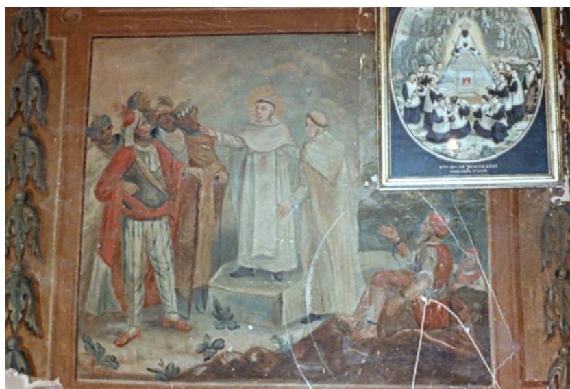
164. Redempció de captius

c). Sant Ramon professa a l'orde de la Mercè, fundada el 1218 per Sant Pere Nolasc a Barcelona, amb el propòsit d'alliberar cristians captius. Com a mercedari, segueix aquesta missió i fa diverses estades a l'Àfrica per tal de redimir presoners, sent, en alguna ocasió, ell mateix encarcerat i torturat. En una escena representativa de la seva intervenció, el sant i un altre frare se situen entremig dels captius i els seus opressors, dirigint-se a aquests amb actitud dialogant.