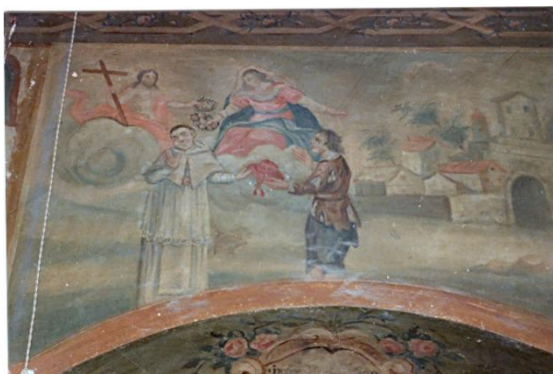
169. Exaltació de Sant Ramon

Sota d'aquesta escena, i en l'arc de la porta, hi ha una orla amb decoració floral, que inclou el nom del pintor, Josephus Dessen, i la data de 1802.