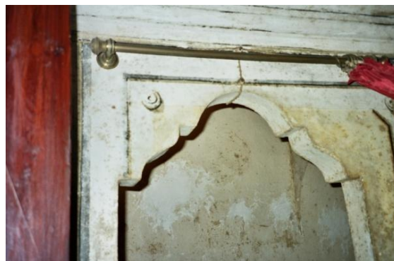
153. Obertura de pas a la sagristia

L'espai, de reduïdes dimensions, es distribueix en dos sectors: l'oratori pròpiament dit i un annex a l'esquerra a manera de petita sagristia. Una obertura a l'envà de separació, acabada en forma d'arc multilíneal, comunica les dues estances.