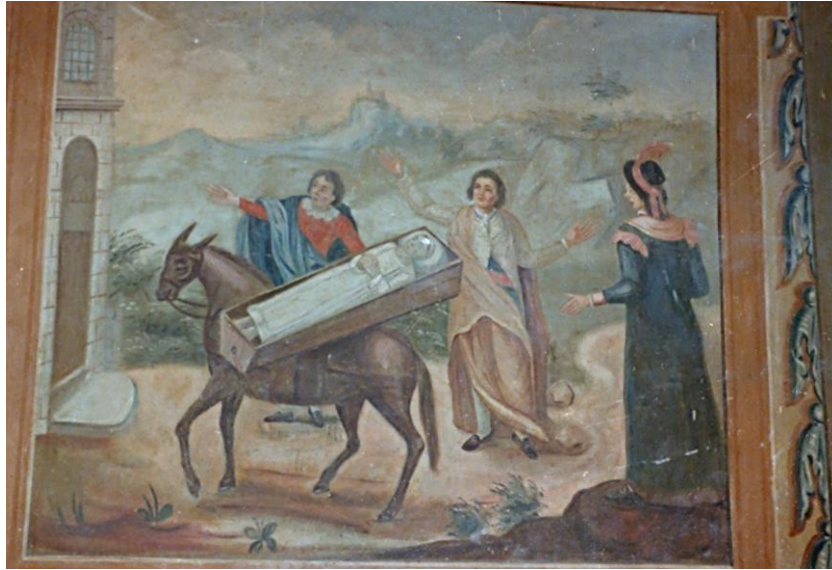
166. Trasllet de les despulles de Sant Ramon

Aquestes cinc escenes principals vénen delimitades per un marc quadrangular i sanefes geomètriques situades horitzontalment, amb motius ornamentals variats. Diverses bandes verticals amb decoració floral completen i enriqueixen el conjunt.