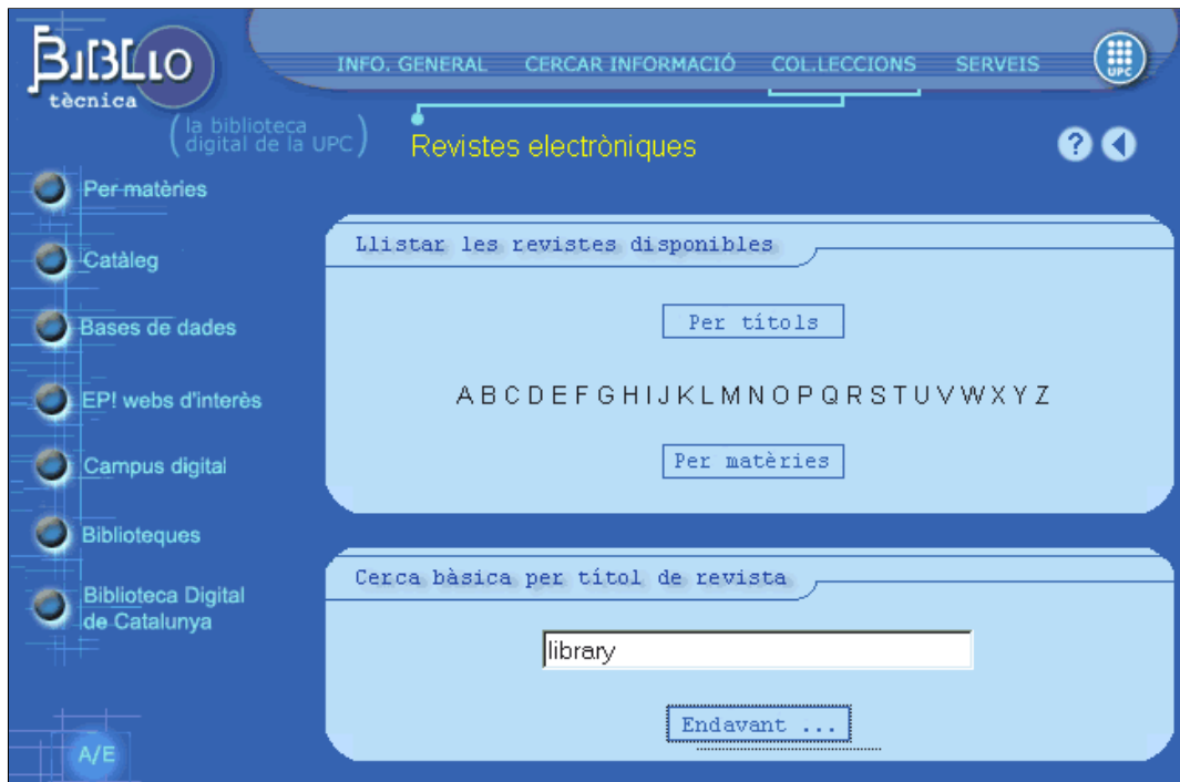
Figura 1. Pantalla de cerca de revistes electròniques a la Biblioteca de la UPC