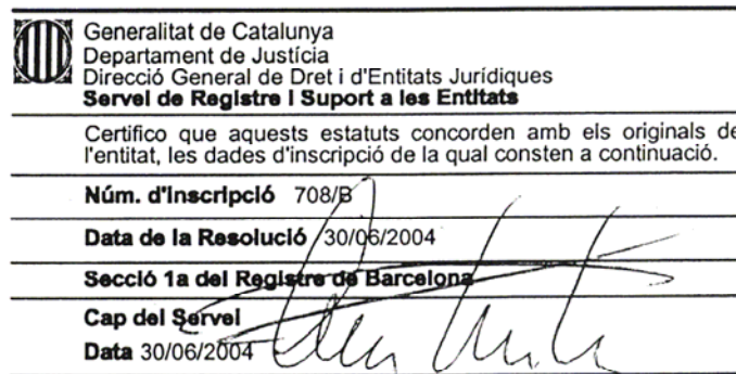
Figura 6.1.- Registro Oficial de los Estatutos.

día 13 de marzo de 2004 y registrados en Registro de Asociaciones de la Generalitat de Catalunya con el número 708/B.