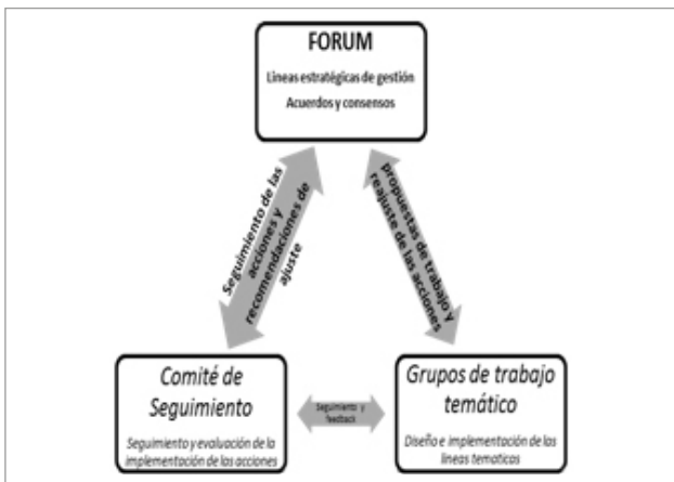
Figura 1. Esquema del proceso de participación y toma de decisiones.

La financiación pública fue mayoritaria (96,48%), con una participación mayoritaria de las autoridades autonómicas y estatales (76,88%), seguida por las aportaciones de la administración local (15,36%). El resto (3,52%) está compuesto por asociaciones locales (productores agrarios, empresas turísticas y asociaciones culturales) y de ONGs. Los acuerdos se garantizaron mediante la aceptación y firma de un protocolo que certificaba las obligaciones y responsabilidades de cada firmante. La estrategia 2007-2012 se organizó en 10 líneas que se correspondían con los diez principios de la CETS (PNDE, 2007). La formulación de las líneas de acción respondió a un amplio proceso de debate vinculado a las propuestas efectuadas por Comisiones Trabajo Temáticas y Comisiones de Seguimiento, ambas creadas para agilizar la operativa. Las propuestas se elaboraron recogiendo las percepciones de los integrantes del Forum, posteriormente, tras evaluar los desajustes derivados de su implementación (desviaciones respecto a los objetivos planificados) fueron revisadas y adaptadas (ver figura 1).