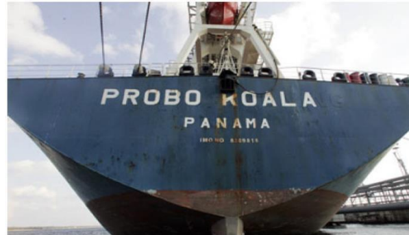
Fig. 8 Picture of the ship that caused a stink