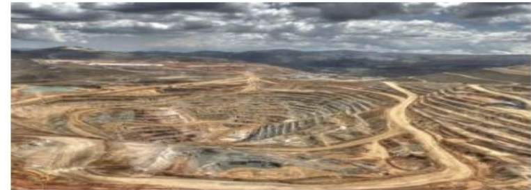
Fig. 10 The Yanacocha gold mine