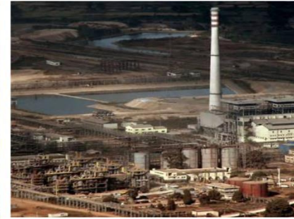
Fig. 7 Images about VEDANTA: Dongria Kondh woman picking millet in Niyamgiri, India (left); Vedanta's aluminium refinery at Lanjigarh, Odisha, seen from the Niyamgiri Hills (right)