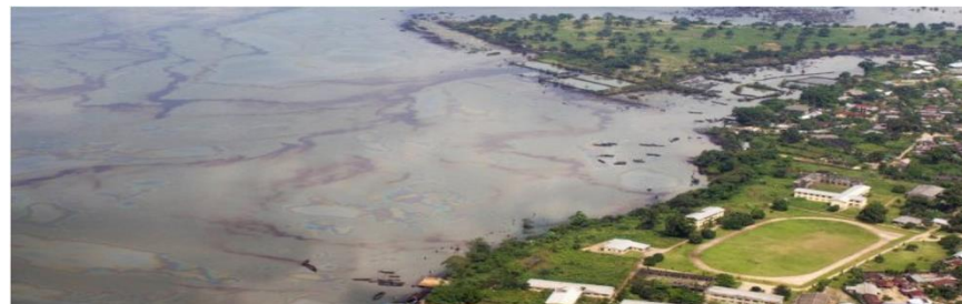
Fig. 15 Floating oil along the coast of Ogoniland, Nigeria